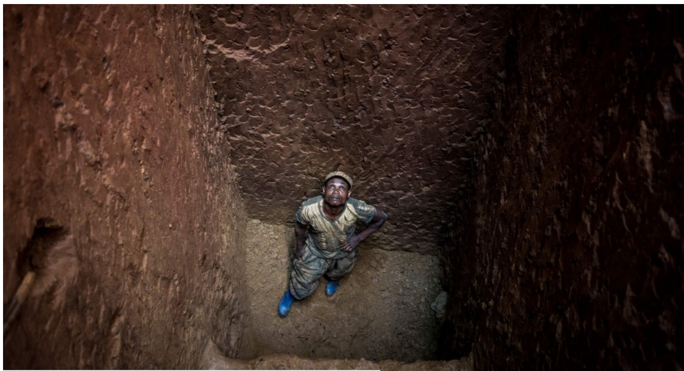
En gruvearbeider kikker opp mot dagslyset i en ikke-industriell gullgruve i Kongo.